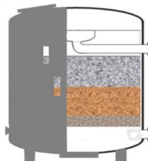
Größere Kohle liegt auf dem feineren Quarzsand.

Vorteil dieser Kombination ist die bessere Tiefenfiltration. Der Schmutz dringt tiefer in das Filtermaterial und belädt den Filter vollständiger, womit die Filterlaufzeit zunimmt.